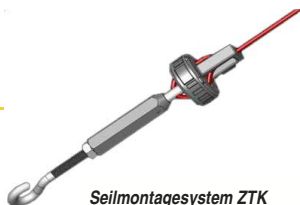
Seilmontagesystem ZTK Zugfestigkeit bis 1500N. Seil an den Enden einfach montieren und justieren.