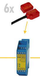
Bis zu 6 ZCode in Reihe an ein SR-Relais